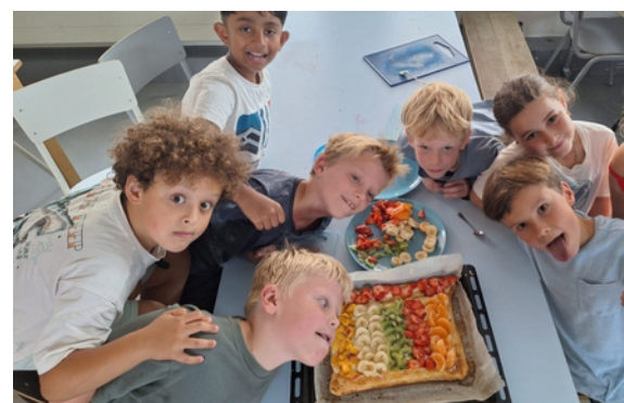
Van samen een zomerse plaatstaart maken, word je ook dikke vrienden.

Een kind is de fotograaf. De andere kinderen gaan dicht bij elkaar staan voor de groepsfoto. Nadat de fotograaf goed heeft gekeken, gaat hij even weg. Eén kind verstopt zich vervolgens achter de groep. De fotograaf moet zeggen wie ontbreekt, vóór de groep tot tien heeft geteld. Goed? Maak de foto maar!