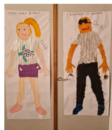
Mooi zoals je bent en iedereen is anders. Zo is het maar net!

Een kind zit geblinddoekt op de trekker, een ander kind trekt deze langs pionnen waar tennisballen op liggen. Bij elke pion geeft het 'ziende' kind het andere kind aanwijzingen om de bal te pakken. Blind vertrouwen in elkaar krijgen.