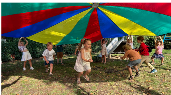
Dit lukt alleen als je goed samenwerkt!

Bij onze jongste kinderen spelen we bijvoorbeeld 'Ik ga op reis en ik neem mee...', en dan mogen er geen sokken of tandpasta mee, maar andere kinderen. Een geweldige manier om snel de namen te leren!