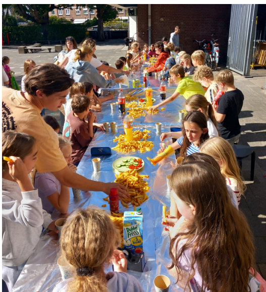
Zo is het schooljaar 23/24 afgesloten: eerst sporten, dan een friet-tafel

We hebben strakke afspraken over schermen. Alle kinderen mogen maximaal 15 minuten op PC of Playstation. Groep 7 en 8 mag een half uurtje op de mobiele telefoon, groep 5 en 6 helemaal niet.