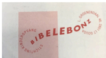
Nieuw adres, dus ook het logo wordt een beetje aangepast