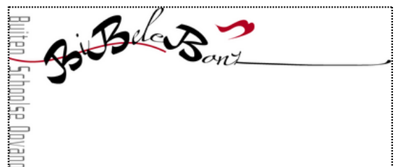
In 2008 slaan we een heel andere logo-richting in