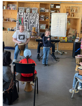
Djembé en zingen: welkom in Afrika.