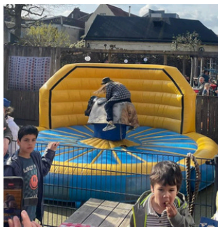
Dat valt dus helemaal niet mee.