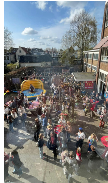
Wat een mazzel met het weer!