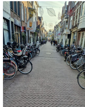
Maar goed dat we de burens gewaarschuwd hadden.