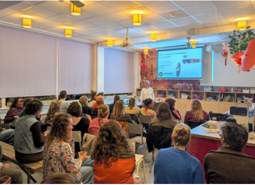
Veel belangstelling bij de ouderavond op 26 maart.

Veel leuke activiteiten weer de afgelopen tijd! Een kleine selectie.