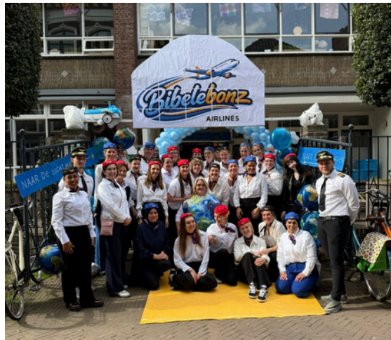
De crew is er klaar voor.