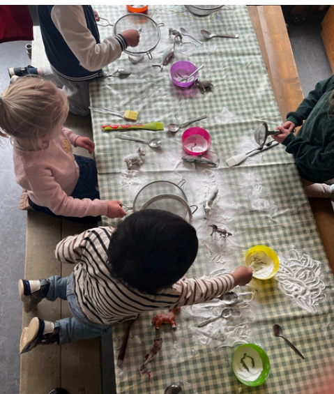
Een zintuiglijke activiteit.