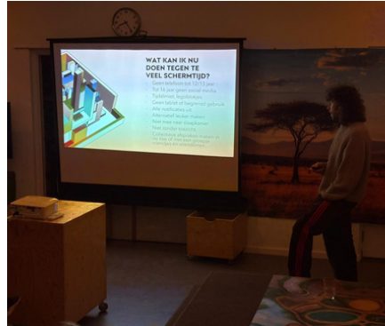
Hoe gaan we om met social media en schermtijd?