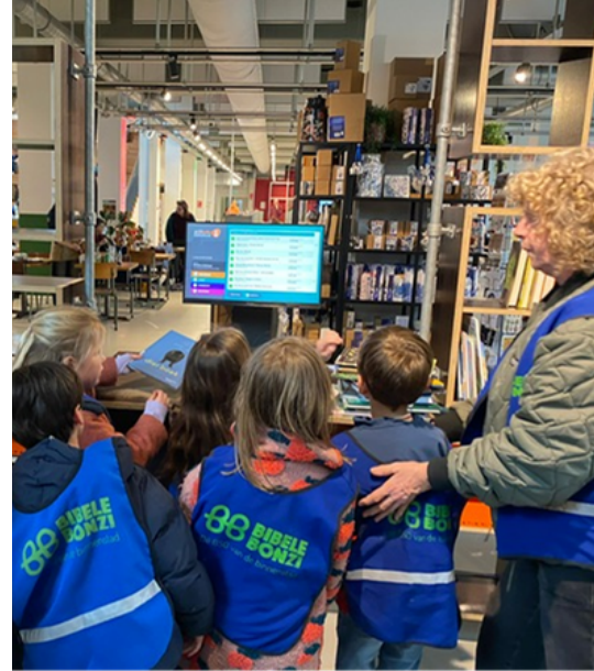
Gezellig nieuwe boeken halen bij de bieb.