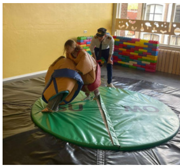
Sumo worstelen: lekker de slappe lach.