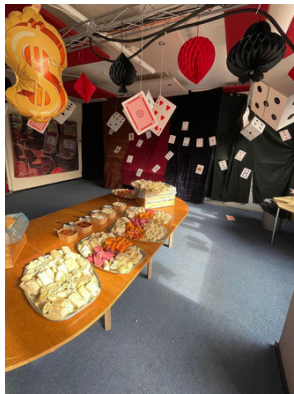
IJskasten vol, wraps gesmeerd, 70 broden...