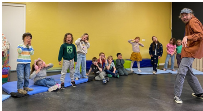
Ook de MiddenBonz-kanjers van groep 2 hebben veel lol met hem.