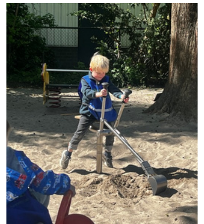
In de Oude Zustertuin kun je spelen en mooie dieren ontmoeten. Dat is een ijzersterke combi voor onze Mini's.