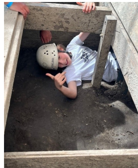
Een moddersurvival. Hoe vies kun je worden en hoe leuk kun je het hebben?