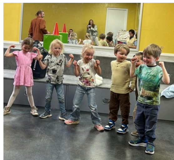
Een buitengewoon energieke theaterdocent van het Hofpleintheater leidt de meespeelvoorstelling 'Ik ben een kanjer'.