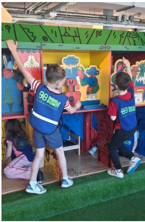
Groep 3 is in Villa Zebra in Rotterdam. Kunstenaars in de dop.