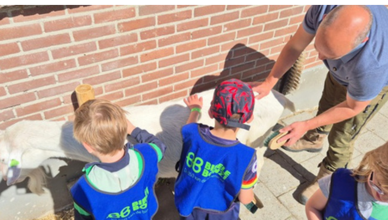
Groep 2 gaat naar de Goudse Kinderboerderij. Ja, die geit kan wel een borstelbeurt gebruiken.