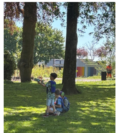
Lasergamen voor de MegaBonzers. Stoere kids!