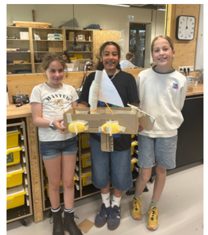
De Tieners zijn in de Techniekwerkplaats van de bibliotheek en maken de mooiste dingen.