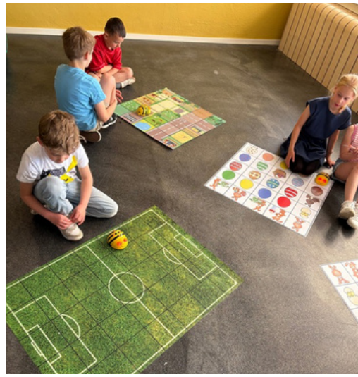
De kinderen uit groep 3 en 4 krijgen een workshop Bee-Bot. Lukt het de bij de route te laten volgen?